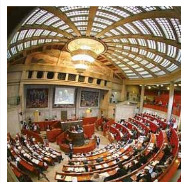
CONSEIL ECONOMIQUE, SOCIAL ET ENVIRONNEMENTAL Grand Débat sur l'innovation dans l'industrie