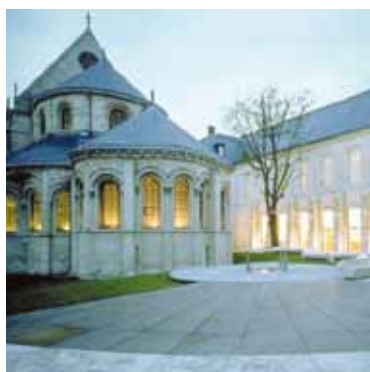
MUSÉE DES ARTS ET MÉTIERS Rencontres thématiques