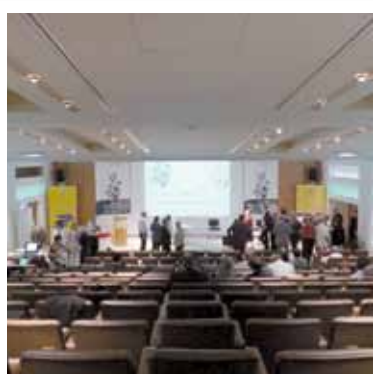
CENTRE DE CONFÉRENCES DU GROUPE LA POSTE 2e et 3e Rencontres Nationales des Directeurs de l'Innovation