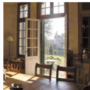
PAVILLON DES AMOURS FUGACES Ateliers méthodes