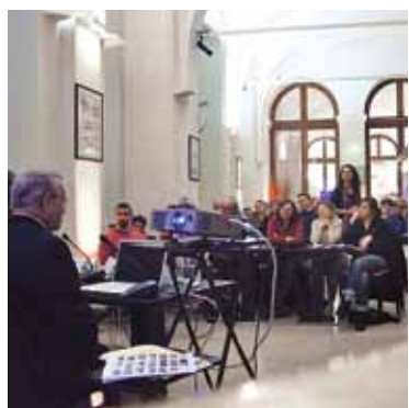
CAFÉ DES TECHNIQUES Repas du Club

Les lieux des rencontres du Club se situent au cœur de Paris ou en périphérie (journées méthodes off).