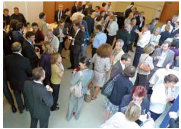
Rencontres multiples entre responsables de l'innovation lors du même évènement.