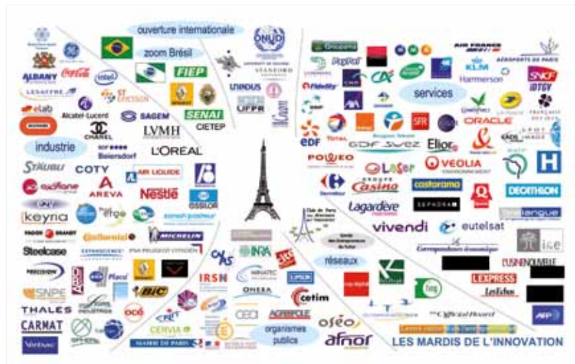
Les organisations ayant participé à la 3ème Rencontre Nationale des Directeurs de l'Innovation