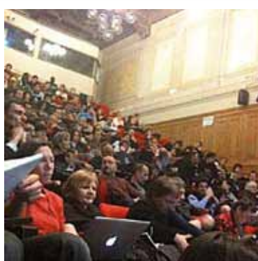
AMPHITHÉÂTRE ABBÉ GRÉGOIRE Mardis de l'Innovation