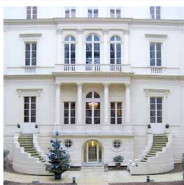
HÔTEL PARTICULIER DE I&E Petits-déjeuners